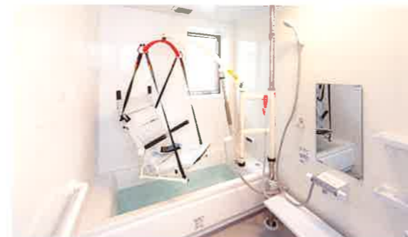
浴室[リフト付]1F・2F ご利用者様のプライバシーと身体状態に合わせ、各ユニットにリフト付の個浴を設置しております。