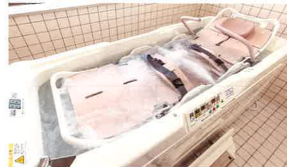
特別浴室…1F 一般浴が身体状況により、入浴が困難な方でも気持ちよい入浴をしていただけます。