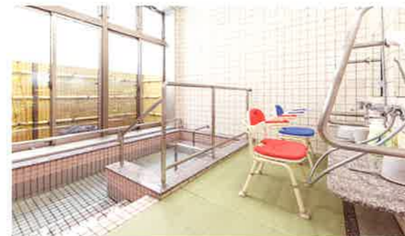
浴室…1F 広々とした浴室と畳を引くことで足元も滑りにくく転倒防止につながります。