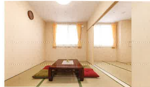
宿泊室[和室]…1F 日中足をのぼしたり談笑したりできる設計です。お泊り時には、ふすまを閉めて個室になります。