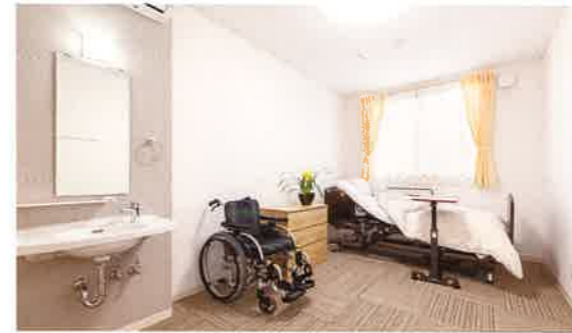
宿泊室…1F・2F 身体状況に合わせてベッドレイアウトが可能です。小規模多機能ホームにはテレビは備え付けてあります。

● = 特別養護老人ホーム[個室29部屋] リンドウ アサガオ ガーベラ ● = 小規模多機能ホーム[9部屋]29名 パンジー