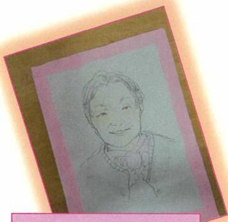
職員が描きました！ そっくりですね。