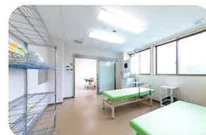
浴室・シャワー浴

ご入居者様に合わせてミキサー食・ソフト食・刻み食に対応可能。誤えんを防ぐ目的も兼ねて、食事は食堂に集まり、看護職員と一緒に楽しく過ごすことを大切にしています。