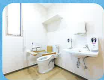
バリアフリートイレ