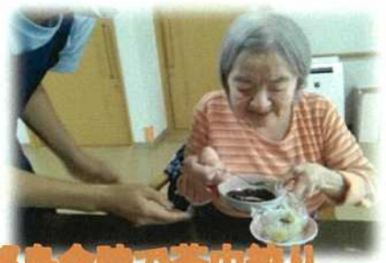
五郎島金時で茶巾絞り