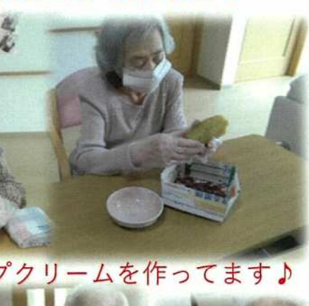
ホイップクリームを作ってます♪