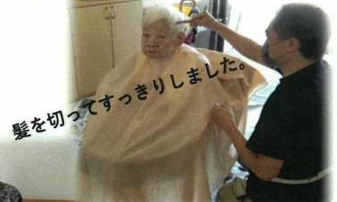
髪を切ってすっきりしました。