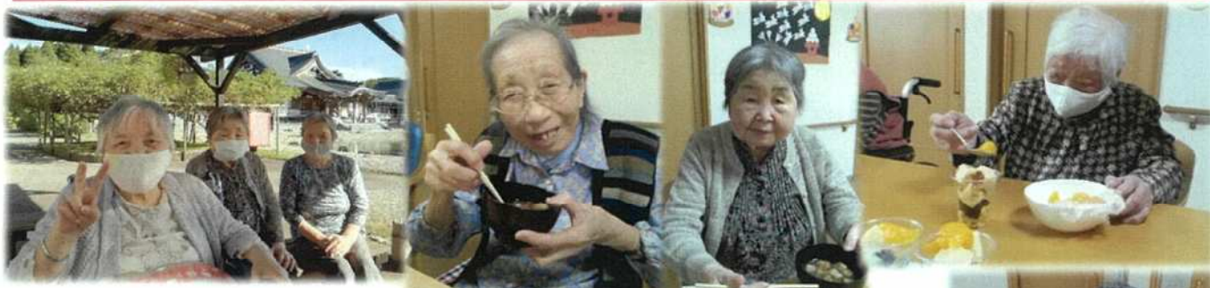
倶利伽羅不動寺へドライブ