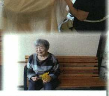
玄関先で秋の風に触れました。