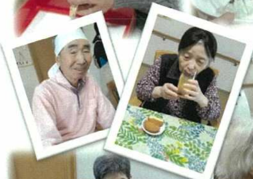
プリンでティラミス