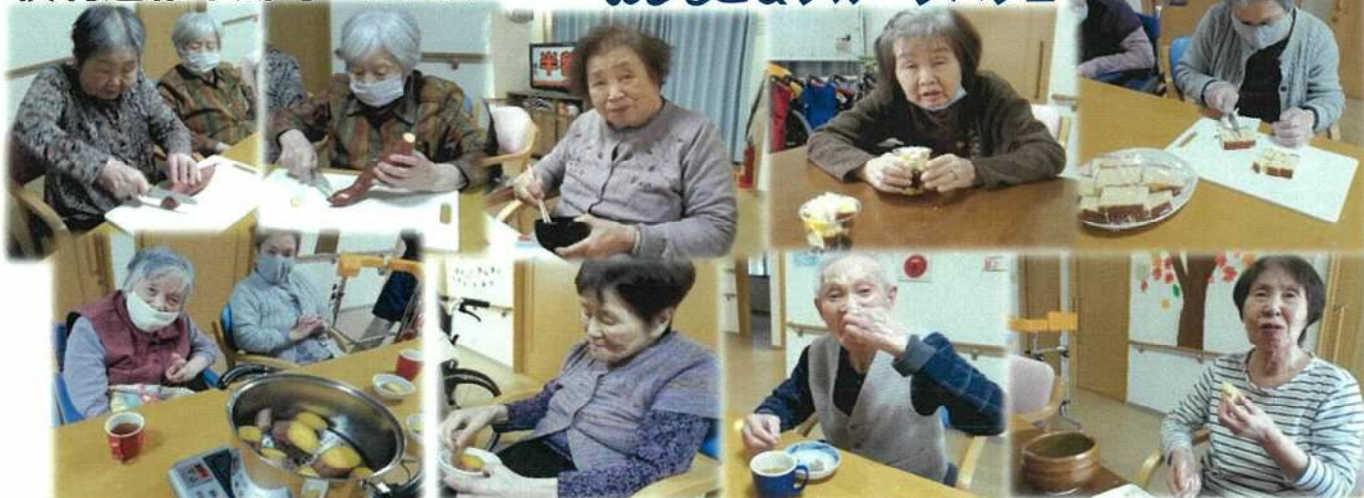
安納芋でふかし芋を作りました！甘くて美味しかったそうです