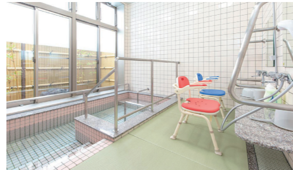
浴室…1F 広々とした浴室と畳を引くことで足元も滑りにくく転倒防止につながります。