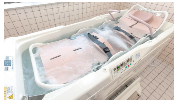
特別浴室…1F 一般浴が身体状況により、入浴が困難な方でも気持ちよい入浴をしていただけます。