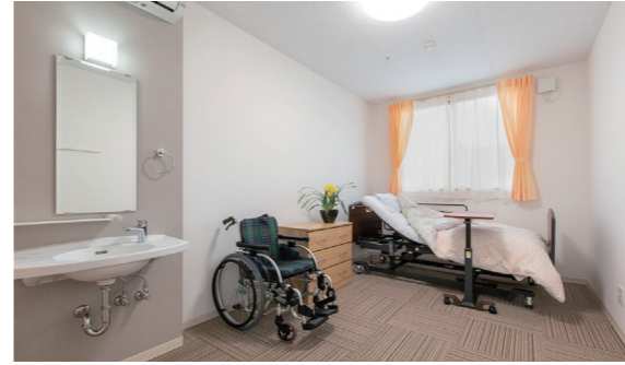
宿泊室…1F・2F 身体状況に合わせてベッドレイアウトが可能です。小規模多機能ホームにはテレビは備え付けてあります。

○ = 特別養護老人ホーム[個室29部屋] リンドウ アサガオ ガーベラ □ = 小規模多機能ホーム[9部屋]29名 パンジー