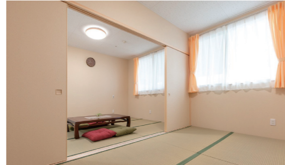
宿泊室[和室]…1F 日中足をのびたり談笑したりできる設計です。お泊り時には、ふすまをしまして個室になります。