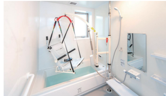
浴室[リフト付]1F・2F ご利用者様のプライバシーと身体状態に合わせ、各ユニットにリフト付の個浴を設置してあります。